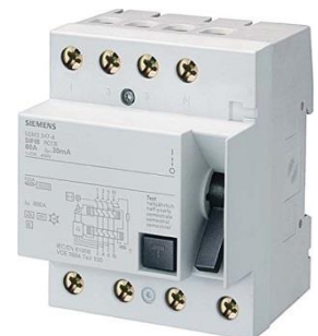
FI-Schutzschalter Typ B

Jeder Anschlusspunkt muss mit einer eigenen Fehlerstromschutzeinrichtung (RCD) geschützt sein (vgl. VDE 0100-722, Teil 7 „Stromversorgung von Elektrofahrzeugen“). In der Regel ist ein allstromsensitiver RCD Typ B erforderlich. Der Elektroinstallateur erteilt hierüber im konkreten Einzelfall Auskunft.